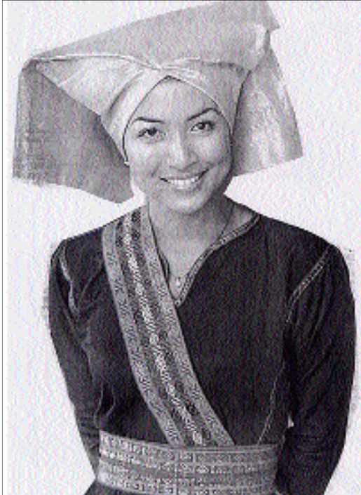
M39. Nữ điện ảnh Tiara