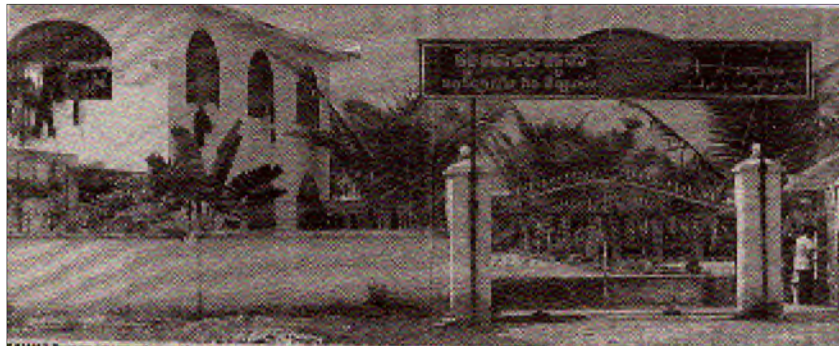
M40. Trung tâm Hồi Giáo

Ánh sáng này không gì hơn là các nước Ả Rập đóng góp tiền bạc để xây dựng một ngôi trường và ký túc xá cho con em người Chăm ở xứ này vào năm 1998. Hôm nay trường gồm có 12 lớp tổng cộng 580 con em học sinh nội trú.